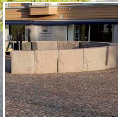
Blockstensmur av Grå Bjärlövsgranit, råkilad

Att råkila en blockstensmur är ett hantverk. Det är inget som kan göras maskinellt, varje kilning kräver kunskap om hur stenen kommer att dela sig. Det krävs också att rätt sten är vald för ändamålet, det är inte alla granitsorter som går att kila med gott resultat. Den Grå Bjärlövsgraniten har exceptionellt goda klyvegenskaper, och går därför även att kila till radiella murar.