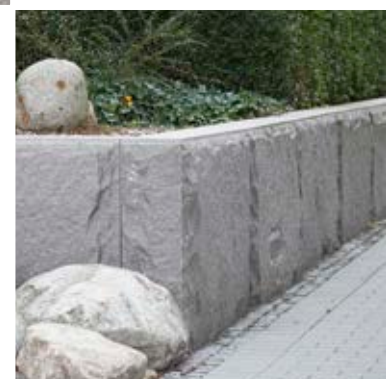
Blockstensmur av Grå Bjärlövsgranit, råkilad med krysshämrad översida.

En råkilad blockstensmur, precis som andra granitmurar, åldras på ett sätt som gör dem vackrare med åren, samtidigt som de kräver minimalt med underhåll.