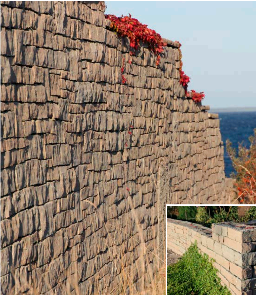
Kallmur av Grå Ölandssten, klippt Objekt: Privat bostadshus