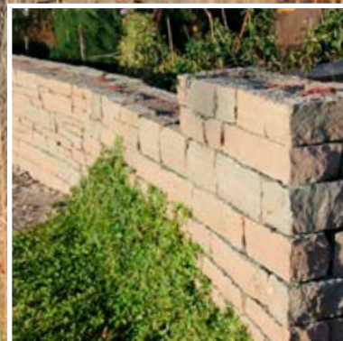
Kallmur av Grå Ölandssten, klippt