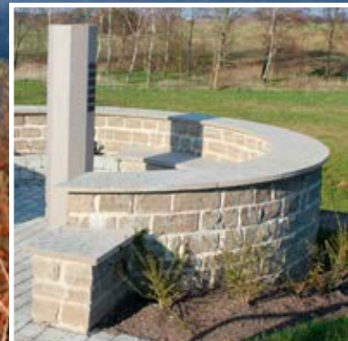
Bruksmur av Grå Ölandssten, klippt

Murar av Ölandssten, som är en svensk kalksten, kan användas både i offentliga och privata miljöer. Olika murtyper, format och kulörer ändrar karaktären på muren avsevärt. När man i dagligt tal pratar om en mur i Ölandssten, brukar tankarna gå till en kallmur av klippt Ölandssten. Genom att fylla fogarna till en bruksmur eller beklädnadsmur finns dock möjligheter att ge muren ett något mer kontrollerat intryck. Genom de olika materialvalen kan kulörerna varieras i olika gråtoner eller i röd kulör. Murar av Ölandssten passar utmärkt tillsammans med hällar av Ölandssten.