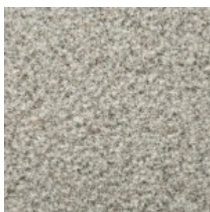
Grå Bjärlövsgranit, krysshamrad

Bearbetningen utförs på slätsågade ytor och ger en plan yta som passar bra när stenens textur och naturliga lyster ska bevaras. Ytan är sträv och halksäker. Framsidan kan utföras råkilad, för att skapa kontrast mot översidan.