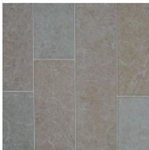
Ölandssten Gillberga Gråbrun

Vi rekommenderar slipad ytbearbetning för golv av Ölandssten. Den slipade ytan motsvarar den patina stenen för av skötsel och slitage. Kulör och textur framträder tydligt med lyster med rekommenderad skötsel. Den slipade ytan fungerar lika bra både i privata miljöer och på golv utsatta för extremt slitage, med Arlandas terminal 5 som tydligt exempel.