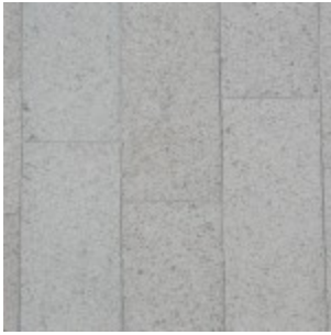
Ölandssten Gillberga Gråbrun