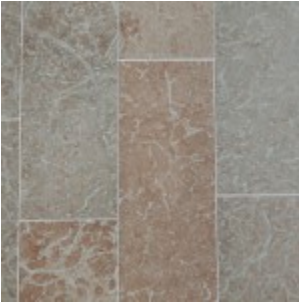
Ölandssten Gillberga Gråbrun G1, slipad

Val av dimensioner, ytbearbetningar och stensorter avgör vilket rumsligt uttryck som skapas.