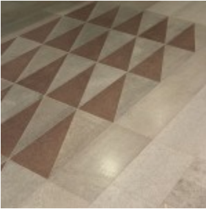
Ölandssten Gillberga Gråflammig G2 och Horns udde Röd B1, hyvlade