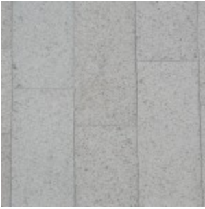
Ölandssten Gillberga Gråbrun