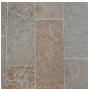
Ölandssten Gillberga Gråbrun G1, slipad

Val av dimensioner, ytbearbetningar och stensorter avgör vilket rumsligt uttryck som skapas.